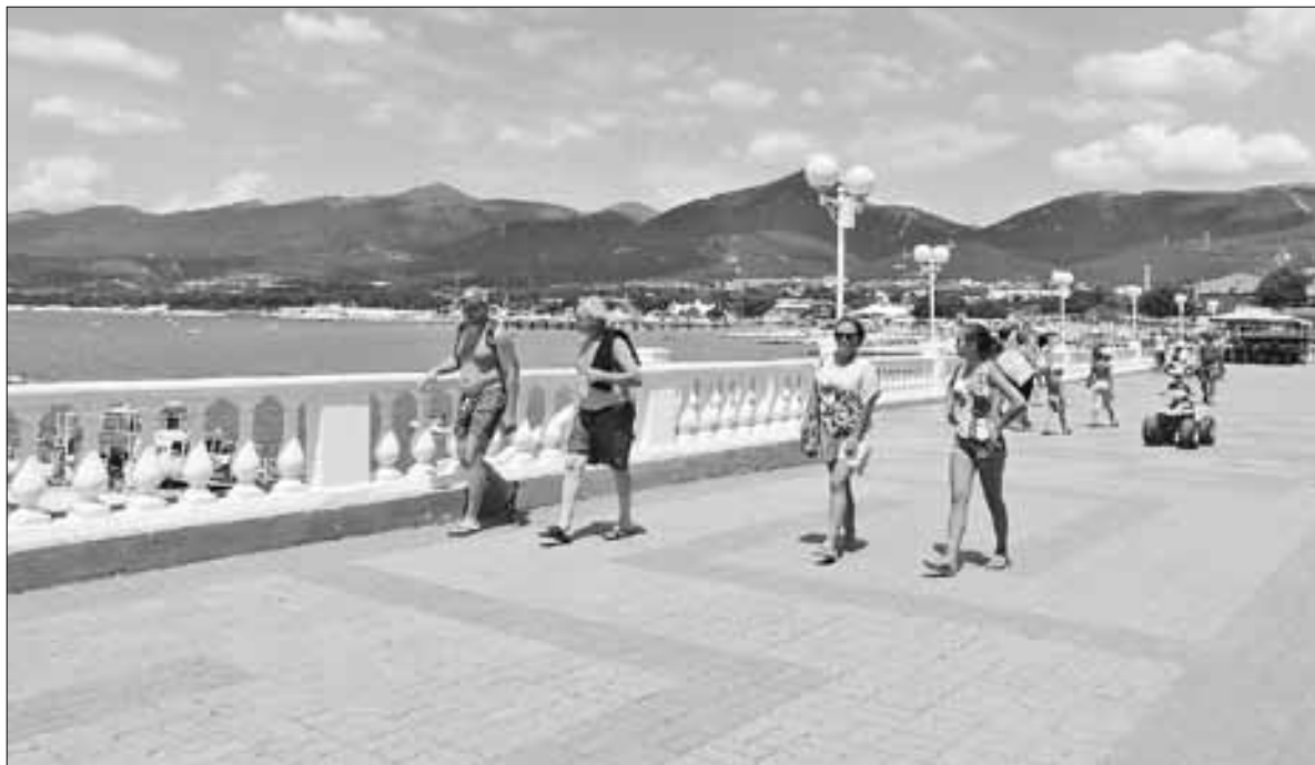
■ На протяжении всей бухты набережная в едином стиле

Отправившись 1 июля в отпуск с двумя детьми по железной дороге, я вооружилась всем необходимым в пути. Но не предусмотрела только одного: что мне может понадобиться в дороге веер, потому что в плацкартном вагоне № 15 поезда «Архангельск – Москва» не работал кондиционер, вентиляция была закрыта наглухо, поэтому пот с нас тек рекой. С каждым часом пути накалялся не только спертый воздух, но и обстановка в вагоне. Пассажиры были готовы растерзать проводника и предлагали до са-