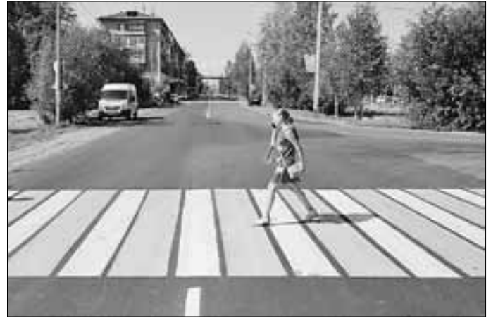
■ Пешеходные переходы на дороге к школе яркие и заметные.