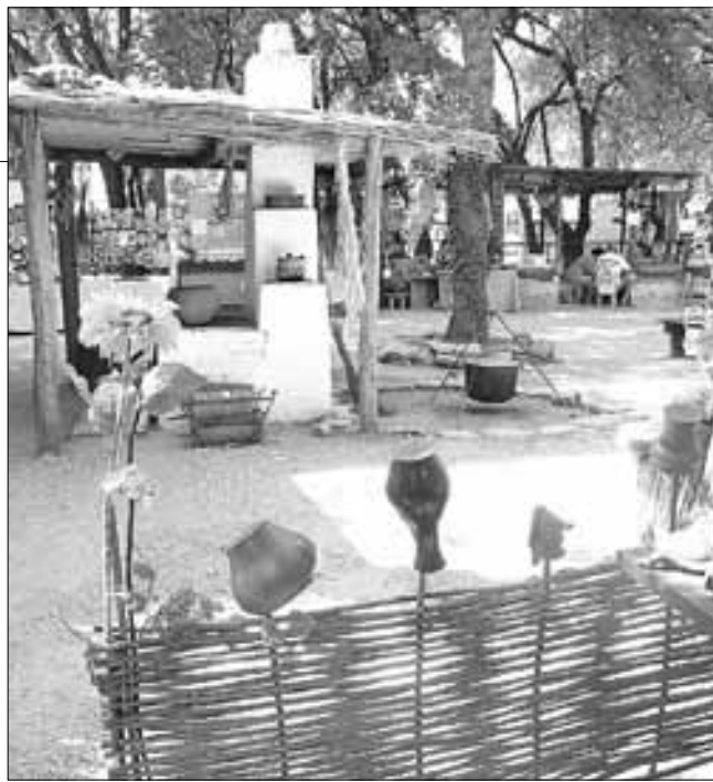
■ В «Городе кубанских мастеров» можно обучиться гончарному и кузнечному делу