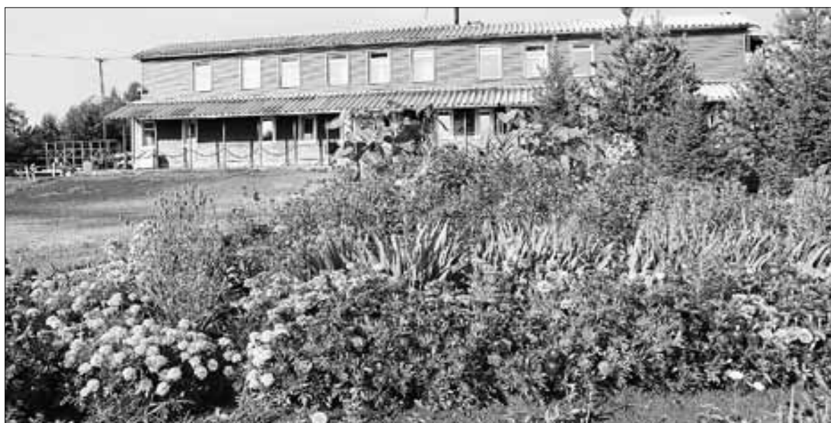
■ ДЮСШ им. Л. К. Соколова. Ул. Советская, 2/1