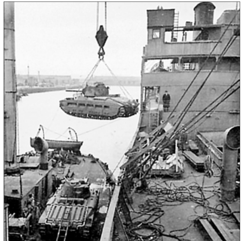
■ Разгрузка корабля Северных конвоев.