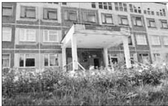
■ Школа № 50. Ул. Краснофлотская, 3