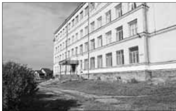
■ Школа № 49. Пр. Никольский, 152