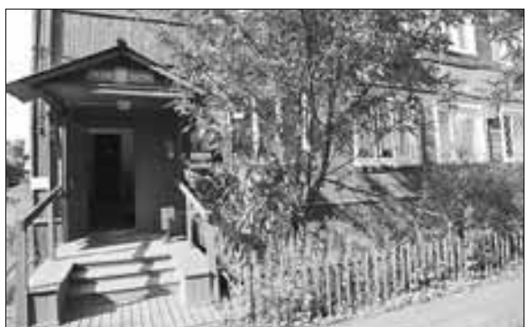
■ Почтовое отделение № 13. Ул. Кедрова, 39