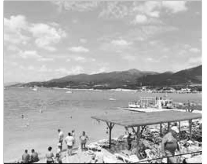
■ Голубое небо, синие горы и изумрудное море