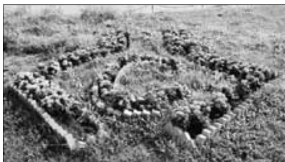
■ Соломбальский машиностроительный завод. Проспект Никольский, 77

– Предприятие недавно якорь отремонтировало и покрасило. Сле-