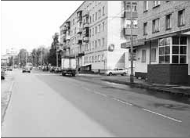
■ Новый асфальт на Никольском проспекте.