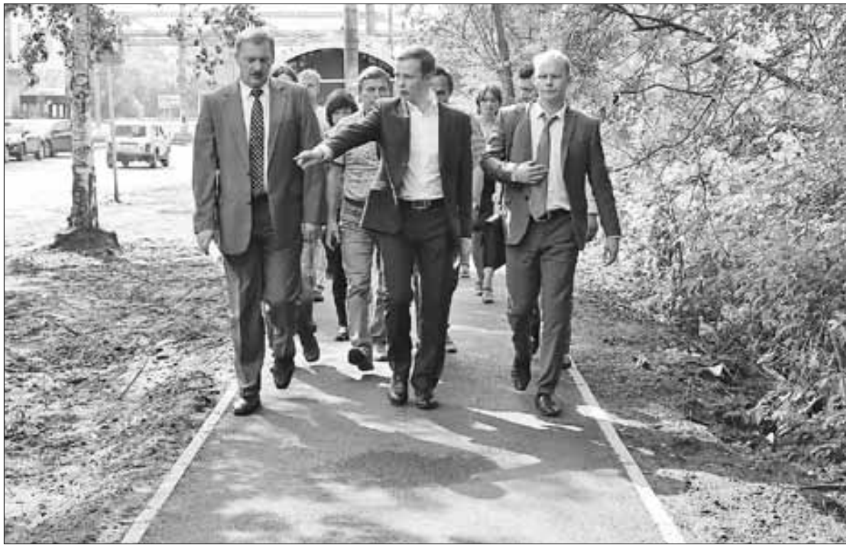
■ Вновь построенный тротуар на улице Адмирала Кузнецова.

В округе проводятся ремонтные работы не только на дорогах, здесь