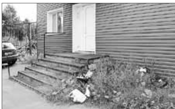
■ БТО тралфлота. Ул. Маймаксанская, 77