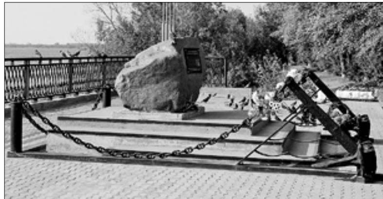
■ Памятный камень «Тем, кого не вернуло море» в Соломбале.

Отрадно, что Архангельск благоустраивается не только на городские и областные средства, но свой вклад в это вносят и инвесторы. Город стал чище, жители бережнее относятся к тому, что сделано, а предприятия, общественные и молодежные организации участвуют в обустройстве памятных мест.