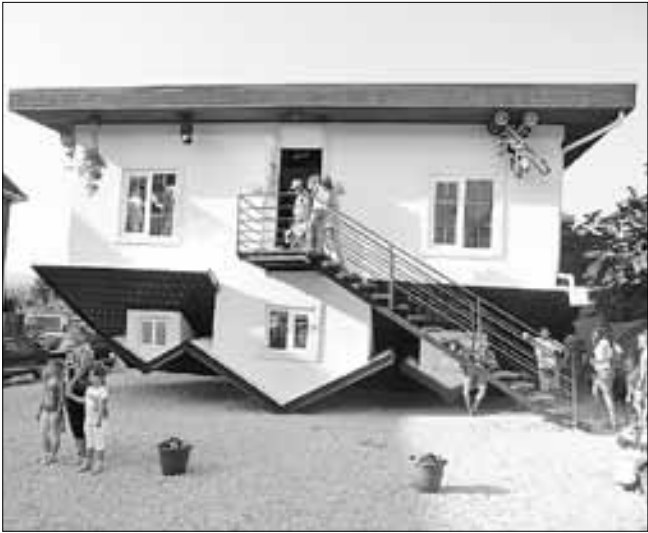
■ В «Доме вверх дном» и кровать на потолке, и даже мультки в перевернутом виде