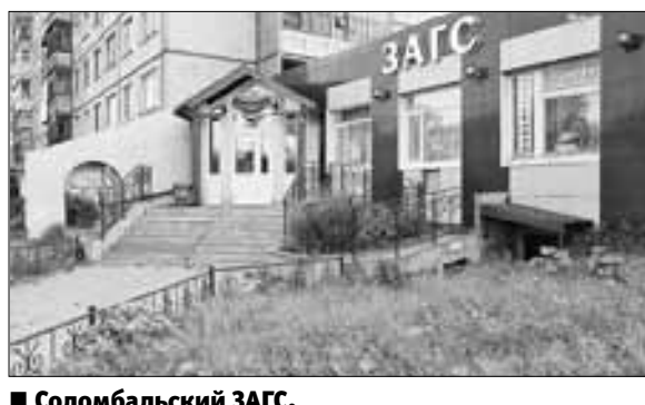
■ Соломбальский ЗАГС. Ул. Красных Партизан, 17/2