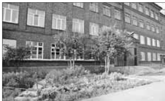
■ Школа № 52. Ул. Маяковского, 41