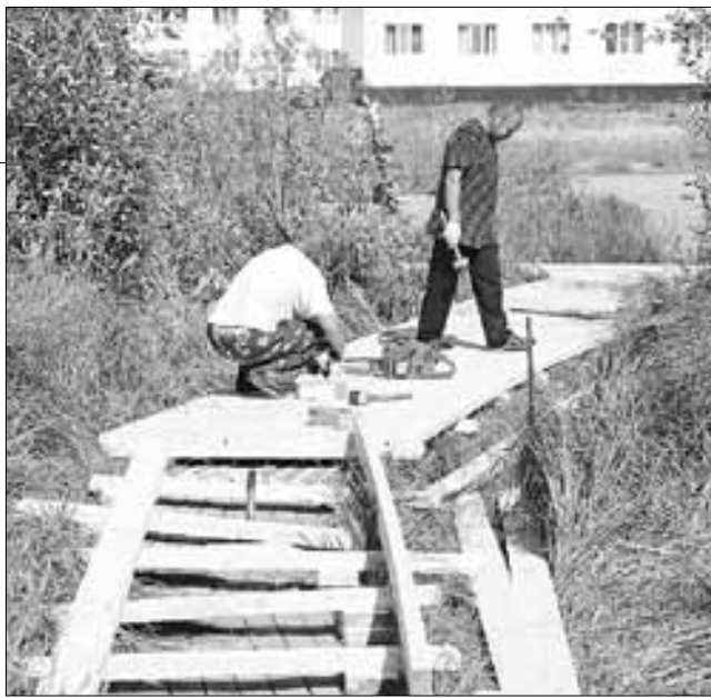
■ В Северном округе завершается строительство деревянных тротуаров.