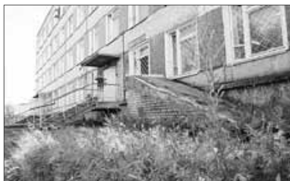
■ Почтовое отделение № 20. Пр. Никольский, 77