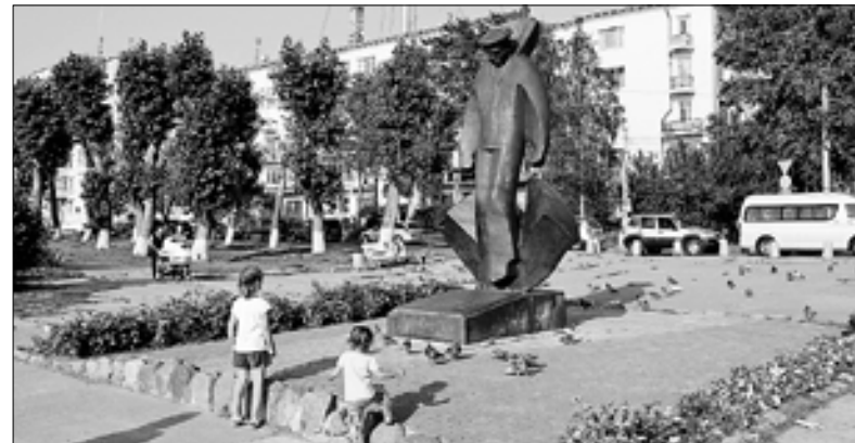
■ У памятника Соловецким юнгам укрепили фундамент.